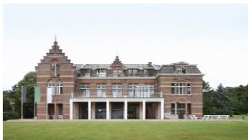
de vylder vinck taillieu, psychiatric institute Kanunnik Petrus Jozef Triestplein, Melle, 2016. Vlaams Architectuurinstituut.