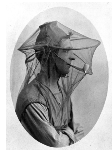
Mosquito headnet with a cap, modelled by a man in profile smoking a pipe, 1902/1918.