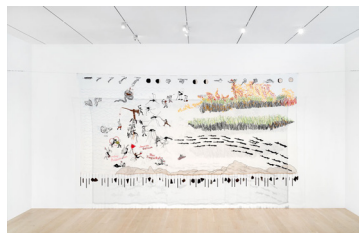
Vivian Caccuri, Mosquito Shrine II , 2020. Institute of Contemporary Art, Miami. Museum Purchase with funds provided by Clarice O. Tavares, and additional support from Graham Dalik.