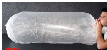
DS+R, Exhaustion , 2017. Directed by Elizabeth Diller. Commissioned by Fondazione Prada.