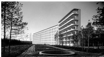
Aino and Alvar Aalto, sanatorium of Paimio, Finland. Exterior view of the south façade, 1930's.